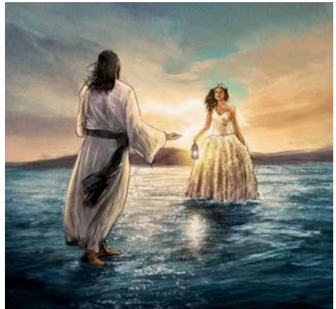
Jesus und Braut

Da die Jünger des Johannes und die Pharisäer zu fasten pflegten, kamen Leute zu Jesus und sagten: Warum fasten deine Jünger nicht, während die Jünger des Johannes und die Jünger der Pharisäer fasten? Jesus antwortete ihnen: Können denn die Hochzeitsgäste fasten, solange der Bräutigam bei ihnen ist? Solange der Bräutigam bei ihnen ist, können sie nicht fasten. Es werden aber Tage kommen, da wird ihnen der Bräutigam weggenommen sein; dann werden sie fasten, an jenem Tag