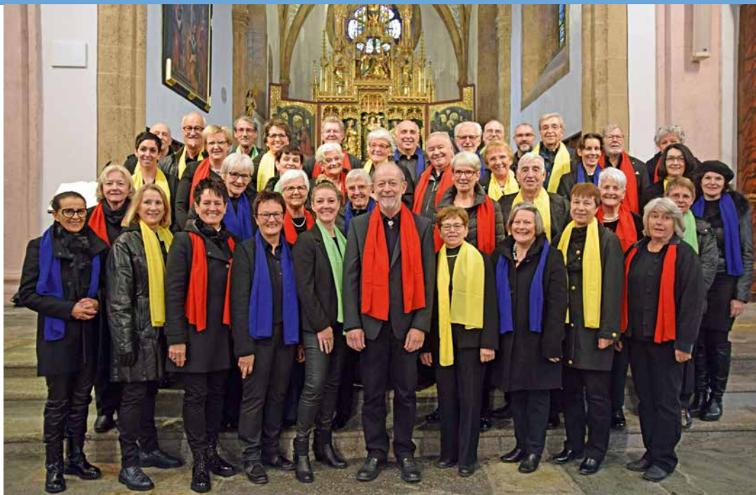
Die Mitternachtsmesse am 24. und den Weihnachtsgottesdienst am 25. Dezember umrahmte der Chor, mit der Missa brevis Sancti Johannis de Deo in B, festlich.