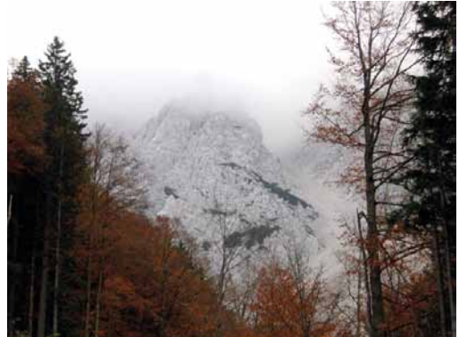
St. Veit, Österreich

November. Nach alter Tradition wird dieser Monat auch Wintermonat genannt. Die Sommerzeit ist vorbei, die Uhren wieder zurückgestellt. Auf dem Friedhof werden die Gräber für Allerheiligen mit dem Winterflor geschmückt.